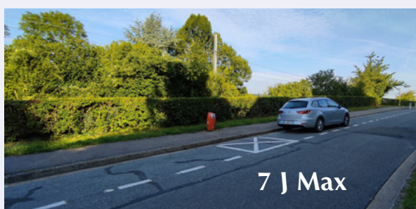
Chemin des Hamards

Sachez aussi qu'une dizaine de places est généralement disponible Chemin des Hamards (en face de l'école). Ces places sont aisément accessibles par le passage sous terrain. Nous incitons donc les personnes qui le peuvent à utiliser celles-ci afin de libérer le stationnement pour nos commerçants.