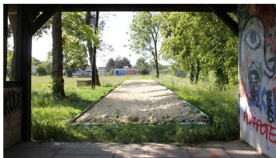
Photo montage - Exemple d'implantation

Les travaux devraient débuter début septembre 2025.