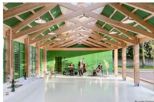
Halle de Chapet

La découverte d'amiante a retardé le lancement de la démolition de la salle polyvalente de l'Espace Pierre Brémard. Pour rappel, cette décision avait été prise après la découverte d'importantes fissures à différents endroits du bâtiment. Il est prévu de bâtir une halle au même emplacement. Pour le moment, aucune date de démolition n'est fixée.