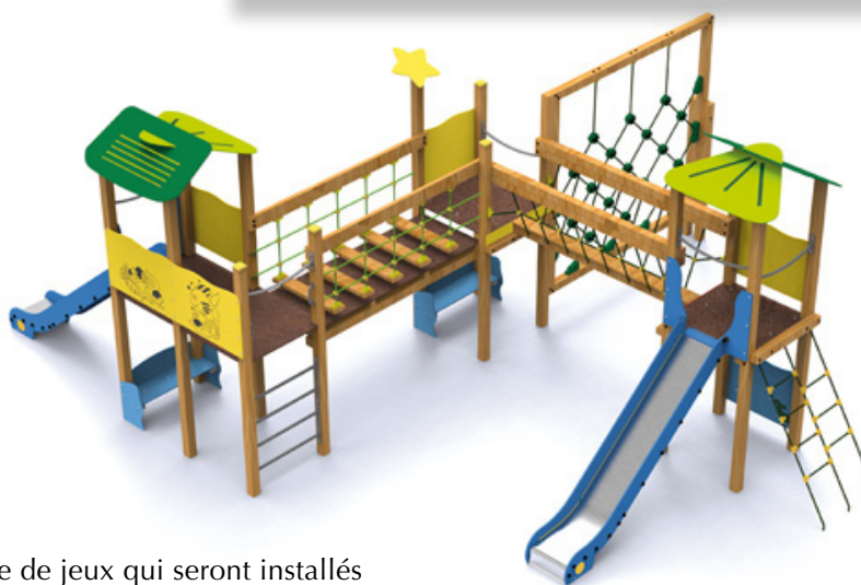
Exemple de jeux qui seront installés